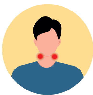
Inflamació dels ganglis limfàtics