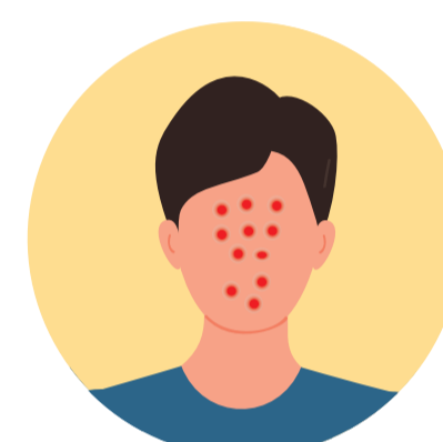
Erupcions a la cara