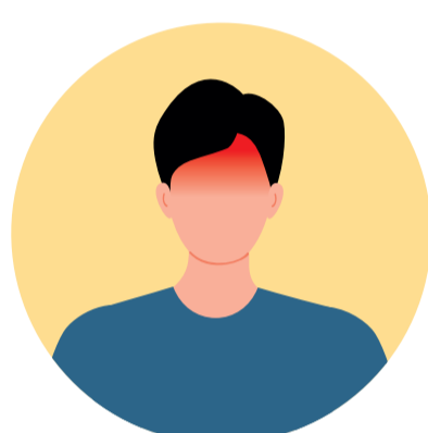
Mal de cap